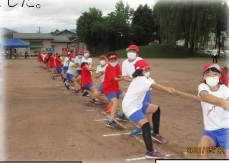
力を合わせて！高学年「綱引き」