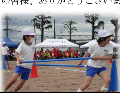
中学年「北斗ハリケーン」二人の息の合った走り

5月22日、心配された雨も北斗の子どもたちの運動会成功にかける熱い思いを感じたのか…曇り空ではありましたが絶好のコンディションとなり、北斗大運動会を無事に開催することができました。今年の運動会は感染予防のための「三密対策」や「熱中症予防対策」のため、徒競走記録会と分散開催をしたり、競技種目を厳選しプログラムを大きく見直したりしました。また、20年ぶりに赤組・白組の2軍対抗の運動会となり、新しい『北斗大運動会』の開催となりました。感染症予防の観点から、大きな声を出して応援することはできませんでしたが、スローガンのとおり、全員が「心を一つ」にして、自分の組の勝利、そして、自分自身の目標達成のために、最後まであきらめずに、全力で競技や応援に取り組みました。結果は下記のとおりですが、それ以上に、競技に向かう真剣さ、仲間との団結、結果を真摯に受けとめる潔さ…等々、北斗の子どもらしい姿をたくさん見ることができたすばらしい運動会になりました。ご参観・ご協力いただきました保護者・地域の皆様、ありがとうございました。