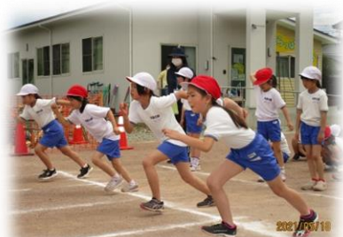
3年女子 緊張のスタート！