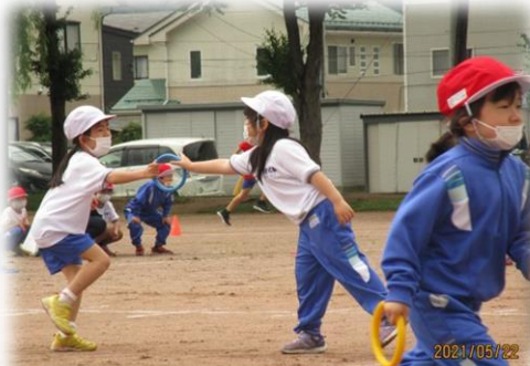
1学年全員リレー バトン渡しもバッチリです