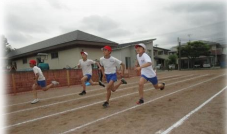
6年男子！大接戦の力走！