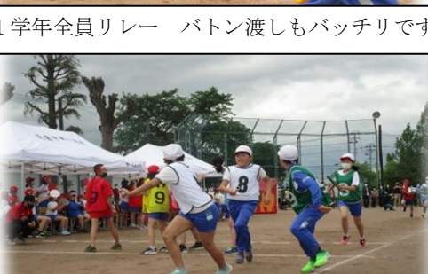
大接戦の6学年全員リレー！