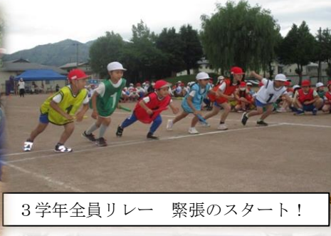
3学年全員リレー 緊張のスタート！