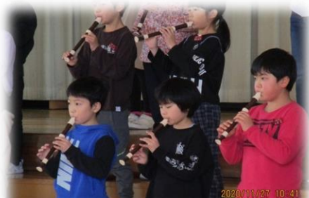
3年生は、音楽で学習したリコーダーの演奏と体育で学習したリズムダンスを披露しました。演奏もダンスも3年生らしい元気なパフォーマンスにお家の方々から大きな拍手をいただきました。

今年度の学習発表会『ほくと発表会』は、新型コロナウイルス感染防止のために各学年で時間や会場を別にしての開催となりました。残念ながら、子どもたち同士が別の学年の発表を見ることはできませんでしたが、お家の方に来ていただき、これまでの学習の成果を存分に発表することができました。各学年とも各教科や総合的な学習の時間、校外学習や修学旅行等で学んだ成果をしっかりと丁寧に表現し、クラスや学年の友だちと協力して発表する姿がたくさん見られました。