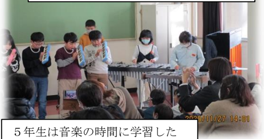
5年生は音楽の時間に学習したリコーダーや打楽器、電子ピアノ、アコーディオン等で、素敵な合奏をクラス毎に発表しました。