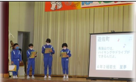
4年生は、社会科や校外学習で学習した「山形県内の市町村」と「月山の特色」について、わかりやすく楽しく、元気に紹介しました。4年生全員がPC（パワーポイント）を活用し、右上のような市町村紹介シートを作成しました。ICT機器を活用した学習にも積極的に取り組んでいます。