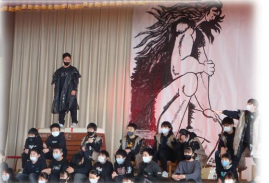
6年生の「朗読劇：三コ」（斎藤隆介：作）では、働く貧しい人々のために命をささげて死ぬ巨人「三コ」の優しさや強さを、堂々とした迫力のある演技や優しく語りかけるせりふ、みんなで心と声を合わせた群読で見事に表現しました。