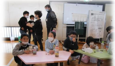
1年生は、国語や生活、図画工作で学習した成果をお家の人に説明したり、制作物を使って一緒に遊んだりしました。かしこく成長した1年生の姿に、お家の方々も笑顔いっぱいでした。