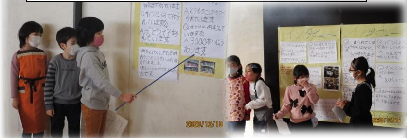
2年生は生活科の学習で「町たんけん」を行い、北部地域のお店や公共施設を訪問し、お店や働いている人たちの様子を調べてきた成果を発表しました。発表の最後に「将来、私は〇〇になりたいと思います。」と自分の将来の夢につなげて発表する姿もみられました。