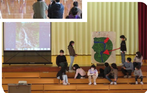
5年生 社会や総合で学んだ、最上川、米作り、川の流れ…学んだことがつながった素晴らしい発表でした