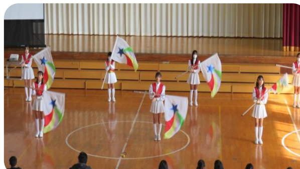
北部太鼓クラブ、カラーガードクラブも練習の成果を披露しました