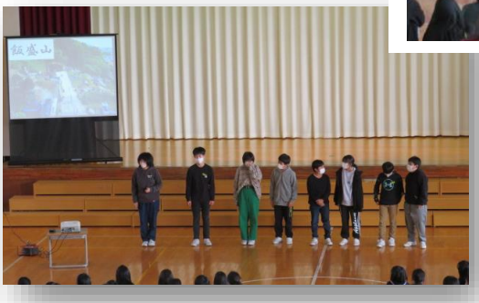
6年生 修学旅行で学んだことを紹介しました。シナリオも自分たちで。実行委員を中心に準備を進めました。