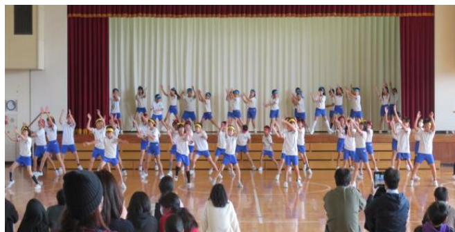
4年生 弾むようなリズムに乗ってキレイのいい動きのダンスと、力強い『ソーラン節』 圧巻でした