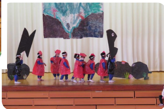
2年生 国語「スイミー」読み取った情景や魚たちの気持ちを劇で表現 小道具も自分たちで