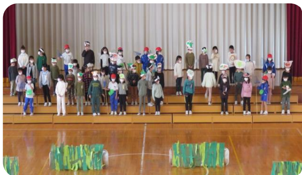
1年生 生活科「虫となかよし」お気に入りの虫になって、調べたことをくわしく伝えました

11月2日・11日の2日に分散して行いました。国語や社会、体育、生活、総合の学習をもとに発展的に取り組んだ学習の発表です。どのようにすれば聞く人に良く伝わるか、アイデアを出し合いながら準備を進めてきた子供たち。発表後は皆、達成感にあふれ大満足の表情でした。